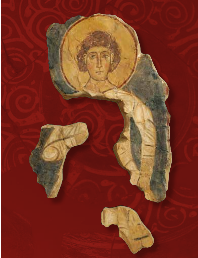
Αργολίδα, ένα σταυροδρόμι πολιτισμών

Η δεύτερη υποενότητα, με τίτλο «Στην αγορά της βυζαντινής Αργολίδας», πραγματεύεται τη δράση των επαγγελματιών σε μια βυζαντινή πόλη, με έμφαση στον κτίστη, τον ζωγράφο και τον κεραμέα, ενώ παρουσιάζονται και εκθέματα που χρησίμευαν στις ποικίλες συναλλαγές και το εμπόριο, όπως οι ζυγαριές, τα σταθμιά και τα νομίσματα. Η υποενότητα ολοκληρώνεται με τους «φορείς» του θαλάσσιου εμπορίου, που δεν είναι άλλοι από τους αμφορείς, ενώ παρουσιάζεται και μία σιδερένια στεφάνη από ξύλινο τροχό άμαξας, ως μάρτυρας του χερσαίου εμπορίου.