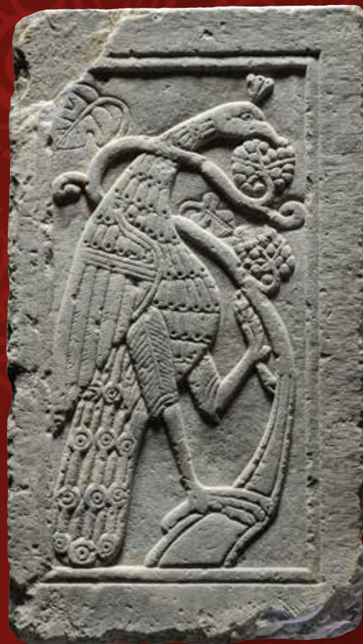
Η ζωή στο βυζαντινό σπίτι

Η τρίτη ενότητα, με τίτλο «Η μεσοβυζαντινή Αργολίδα», αποτελεί την «καρδιά» της έκθεσης, συγκεντρώνοντας την πλειονότητα των εκθεμάτων. Οργανώνεται σε τρεις μεγάλες υποενότητες, από τις οποίες η πρώτη επικεντρώνεται στην εκκλησία, η οποία στους μεσαιωνικούς χρόνους καθίσταται κέντρο όχι μόνο της δημόσιας λατρείας, αλλά και της δημόσιας ζωής ευρύτερα, αντικαθιστώντας κατά κάποιον τρόπο την Αγορά των αρχαίων χρόνων. Ο χώρος είναι διαμορφωμένος ως μικρό παρεκκλήσι, με σημαντικές κτητορικές και αφιερωματικές επιγραφές στην είσοδό του, και μαρμάρινα μέλη και τοιχογραφίες στο εσωτερικό του.